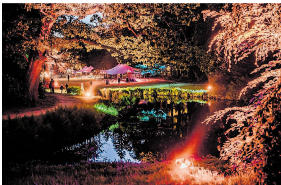
Als de avond valt op het Oranjewoud Festival.

Ten derde het echt klassieke festival: „Voor de echte liefhebber van Haydn, Mozart, Beethoven, Brahms, dat soort genieën”. De muziek van vroeger die wel is blijven hangen, dus.