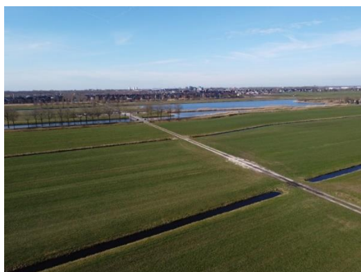
Foto 1. Ongeschikte locatie (oostzijde museum)

Om de voorstelling mogelijk toch door te laten gaan, is er meteen gekeken naar een alternatieve locatie. Deze is gevonden en is aan de organisatie voorgesteld en besproken, zie de onderstaande foto's.